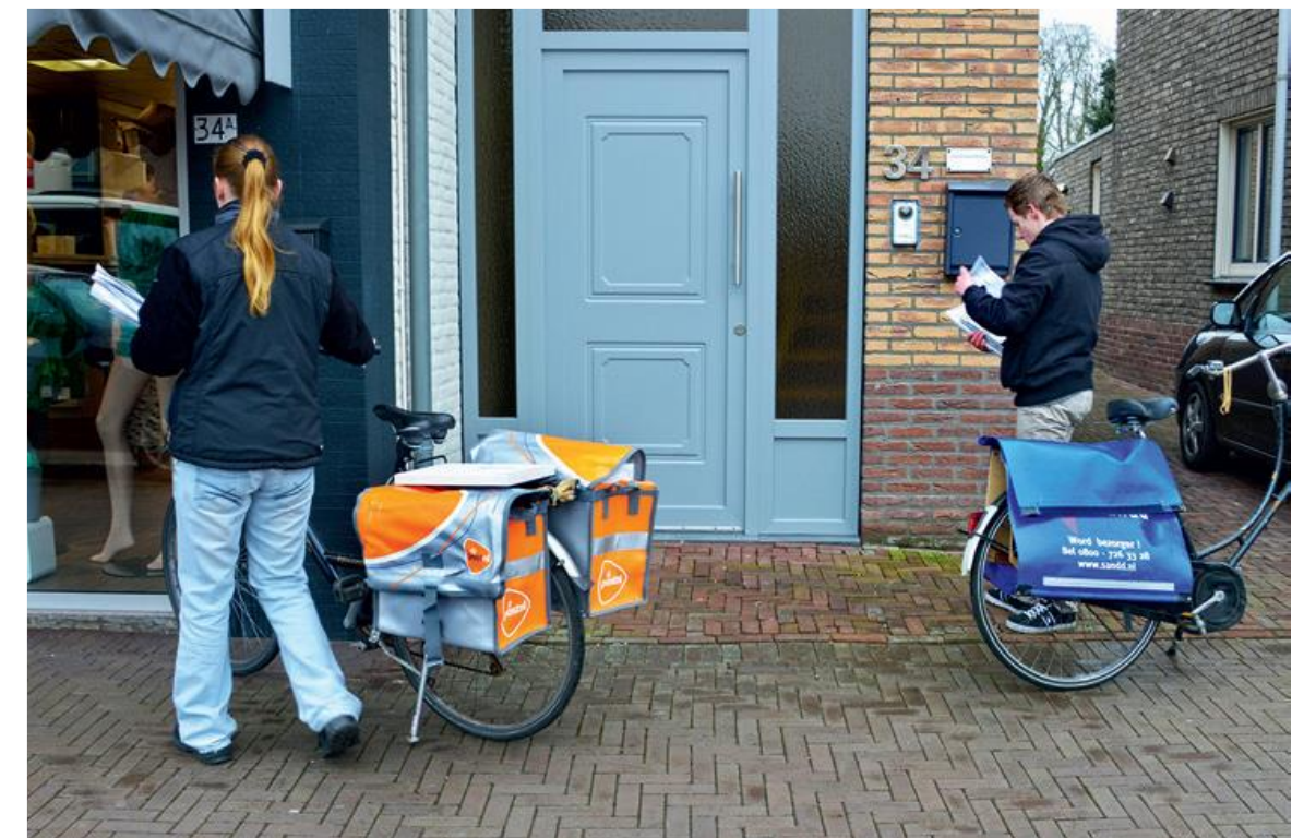
PostNL en Sandd: overname of fusie?