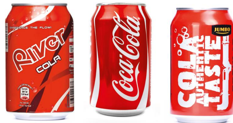
Cola: een heteroogeen product

Heterogene goederen hebben voor consumenten belangrijke verschillen: voor hen maakt het uit wie het product levert → merk- en smaakvoorkeur.