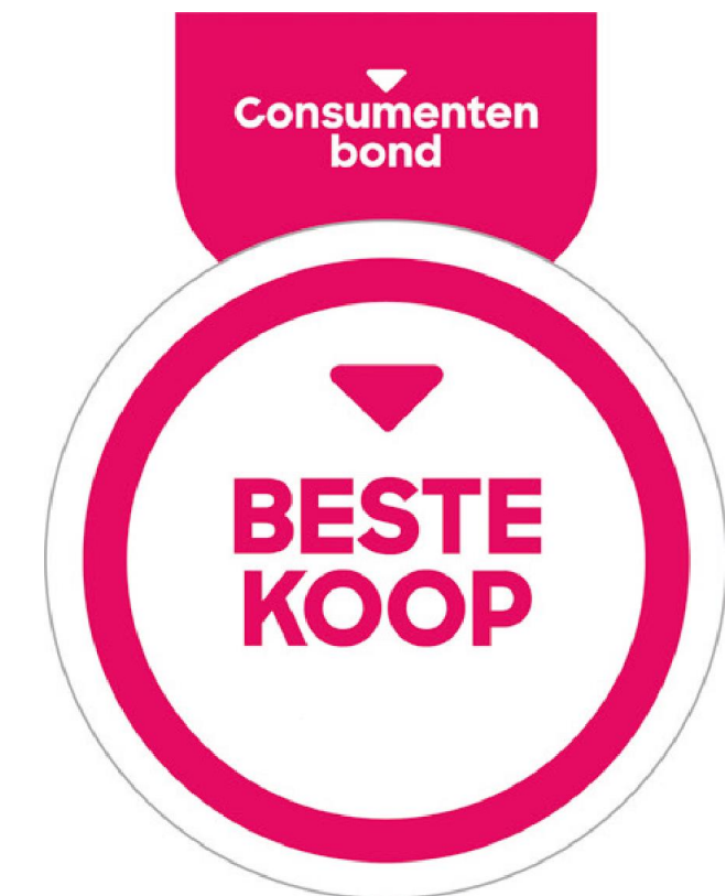
Beste verhouding prijs-kwaliteit